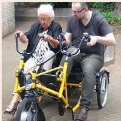
Vrijwilliger samen met bezoeker op de duofiets

Vouchers voor gratis activiteiten zijn aan de doelgroep uitgedeeld om mensen te verleiden de deur uit te gaan, om weer “mee” te gaan doen of actiever (sociaal en fysiek) te worden.