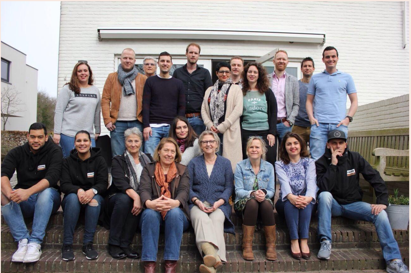
Medewerkers Renkum voor Elkaar in 2017

In de eerste maanden van 2017 is met name door de groep van kwartiermakers veel tijd en aandacht besteed aan het vormen van een adequate organisatie en aan het formuleren van een gezamenlijke visie en missie. Medio 2017 is door deze groep besloten de opstartfase als beëindigd te beschouwen en als projectgroep verder te gaan met de ontwikkeling van Renkum voor Elkaar. De RvE-medewerkers hebben maandelijks een gezamenlijk overleg waar informatie en ervaringen uitgewisseld worden. In 2017 heeft dat geleid tot een gezamenlijke aanpak van vragen en initiatieven die bij RvE binnenkomen en tot nadere kennismaking met elkaars werkwijzen en steeds meer gebruik maken ook van de mogelijkheden die RvE daarmee heeft. De partners hebben in meerderheid de gestelde prestaties behaald, soms zelfs ruimschoots en daar zijn wij uiteraard erg trots op. 1